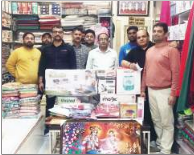
प्रशंसा करते हुए बताया की संस्था के द्वारा अभी तक 50 शादियों में कन्यादान किया जा चुका है आज 2 अलग अलग परिवार की 2 बेटियों