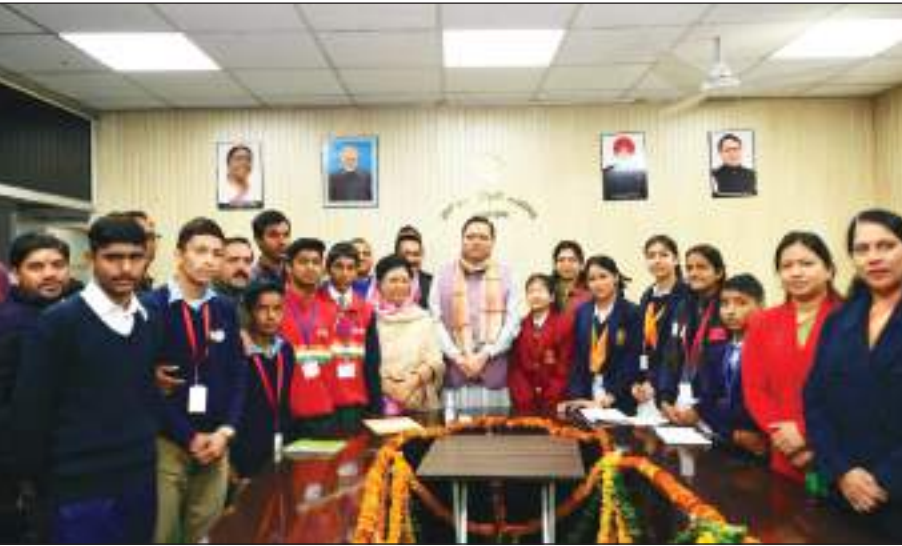
उत्तराखंड के मुख्यमंत्री पुष्कर सिंह धामी ने टिहरी में "आत्मनिर्भर टिहरी की संकल्पना" विषय पर प्रतिभाशाली स्कूली छात्र-छात्राओं के साथ संवाद किया।