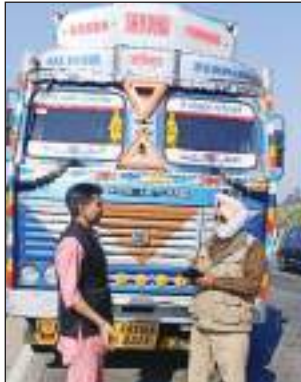
भाग 5 अन्तर्गत सुनिश्चित करेंगे कि प्रत्येक भारी वाहन व गति प्रतिबन्धित वाहन अपनी निर्धारित गति सीमा में

के नियमों की पालना दृढ़ता से करवाई जाए। मोटर वाहन अधिनियम-2017 की धारा 4 के भाग 5 के अन्तर्गत निर्धारित गति सीमा व बाईं लेन में ना चलकर नियमों की उल्लंघना करने पर आज 25 फरवरी 2023 को 57 भारी वाहनों के चालान किए और अब तक बीते 294 दिनों में 12691 भारी वाहनों के चालान किए जा चुके हैं। पुलिस अधीक्षक अम्बाला ने उप-पुलिस अधीक्षक, यातायात अम्बाला व प्रबन्धक थाना यातायात को निर्देश दिए थे कि आप मोटर वाहन अधिनियम-2017 की धारा 4 के