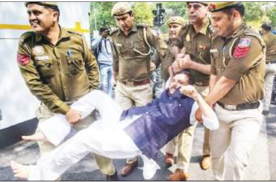
विरोध प्रदर्शन कर रहे आप सांसद संजय सिंह को दिल्ली पुलिस के जवान ले जाते हुए।

समाज के लिए जेल जानें तो जेल जाना दूषण नहीं, भूषण होता है। प्रभु से कामना करता हूँ कि आप जल्द जेल से लौटें। दिल्ली के बच्चे, पेरेंट्स और हम सब आपका इंतजार करेंगे। अरविंद केजरीवाल ने कहा कि जिस देश में गरीब बच्चों को अच्छी शिक्षा देने वाले और उन बच्चों का भविष्य बनाने वाले जेल में हों और अरबों का घोटाला करने वाले प्रधानमंत्री के जिगरी दोस्त हों, वो देश कैसे तरक्की कर सकता है।