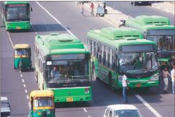
स्कूल, चिड़ियाघर के पास, नेशनल स्पोर्ट्स क्लब ऑफ इंडिया और प्रगति मैदान के गेट नंबर -10 के पास कुल