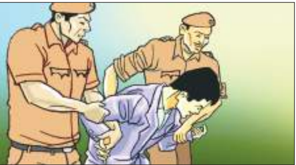
नाम के युवक ने अपनी हॉंडा सिटी कार चोरी होने की शिकायत की। शिकायतकर्ता ने बताया कि एक